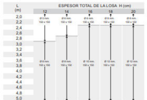
Armaduras de reparto y en condiciones mínimas.

Es muy recomendable recurrir a una solución con malla electrosoldada continua en toda la losa.